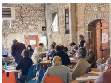
Atelier au Gamounet sur les outils et acteurs pour raconter le patrimoine.