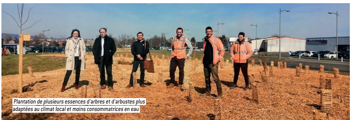
Plantation de plusieurs essences d'arbres et d'arbustes plus adaptées au climat local et moins consommatrices en eau