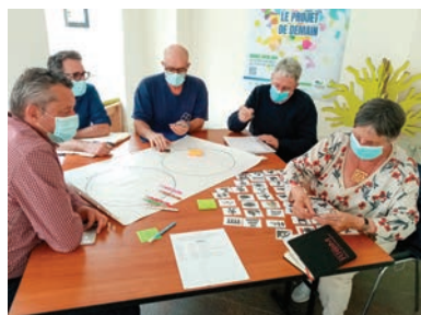
Atelier à l'Office de tourisme sur la complémentarité culture-tourisme.